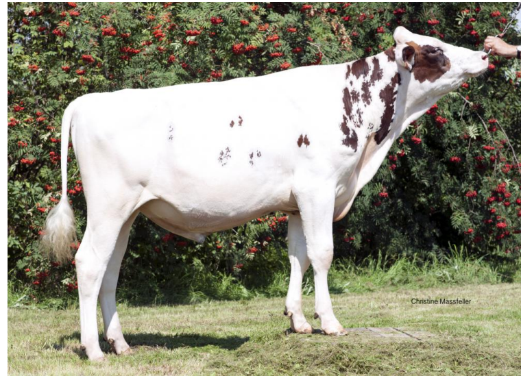
HHF Emir P Red

Emir P Red stammt aus einer hervorragenden Kuhfamilie, welche durch hohe Lebensleistung (M: >60 000kg, GM: >120 000kg, UGM: 98 000kg, jeweils mit sehr guten Inhaltsstoffen) und exzellente Einstufungen über Generationen besticht. Emir P Red stammt NICHT aus ET und vererbt gute Leistung sowie hervorragende Fitnesswerte mit guter Melkbarkeit. Im Exterieur überzeugt Emir durch gute Fundament- und exzellente Eutervererbung. Mit 125 Euterzuchtwert ist er noch immer einer der höchsten roten, hornlosen Vererber. Er ist auch sehr gut für AMS-Betriebe geeignet (RZRobot 107), kann bei Färsen eingesetzt werden und überzeugt auch bei den Gesundheitswerten. Emir stammt nicht aus ET.