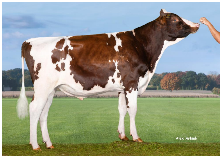
GG Frank PP Red

Frank PP Red ist ein attraktiver, reinerbig hornloser Vererber und geht zurück auf Glen Drummond Splendor VG-86 und damit auf die sehr erfolgreiche Familie von Sympatico, Durham Red oder MR Savage. Seine Großmutter TWR Fire P Red produzierte in der 4. Lakt. (305): 14.690 kg Milch und über 1.000 F+E kg. Frank selbst überzeugt durch ein sehr komplettes Profil mit hoher Milchleistung, sehr guten Gesundheitswerten, positiver Melkbarkeit bei guter Eutergesundheit und hoher Nutzungsdauer. Beim Exterieur überzeugt er mit einem attraktiven Linear mit guter Fundament- und Eutervererbung sowie etwas mehr Stärke und Körpertiefe bei durchschnittlicher Größe. Frank ist für Färsenbesamungen geeignet, hat einen RZRobot von 111 und testet Kappa-Kasein BB.