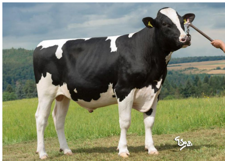
DG DV Caelum

Caelum ist ein töchtergeprüfter Vererber der Extraklasse und geht über die sehr einflussreiche Großmutter Larcrest Cale auf die HI Welt-Kuh des Jahres 2016 Larcrest Crimson EX-94 zurück. Caelum überzeugt durch eine gute Leistung mit positiven Inhaltsstoffen, sehr guter Eutergesundheit, einer hohen Nutzungsdauer sowie einem sehr ausgeglichenen Exterieur. Caelum vererbt zudem die Top-Kombination Kappa-Kasein BB und Beta-Kasein A2A2.