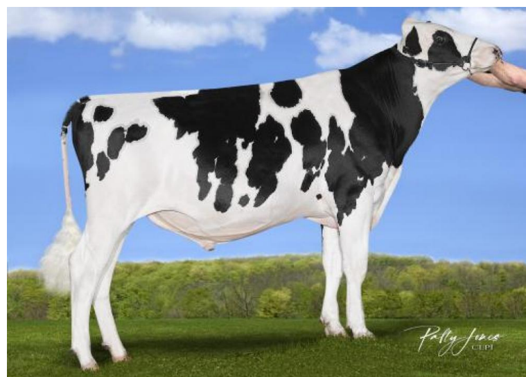
Jook Einstein QUALITY

Quality ist ein Sohn von Silverridge Einstein, der durch seine Töchter imponiert und sich als Bullenvater zunehmend einen Namen macht. In der Mutterlinie stammt Quality aus der selben Familie wie T-Spruce Lionel, was die Vererbungskraft der Familie für hohe Leistungen dokumentiert. Quality präsentiert sich mit 3197 GTPI als überragender Allrounder mit sehr hoher Milchleistung bei guten Inhaltsstoffen (plus Beta-Kasein A2/A2 und Kappa-Kasein BB), einer hervorragenden Eutergesundheit, Töchterfruchtbarkeit und Nutzungsdauer sowie leichten Geburten. Die Töchter sind durchschnittlich in der Größe, haben eine offene Rippe, breite Becken und sehr gute Fundamente. Die hoch aufgehängten Euter haben ein sehr festes Zentralband und längere, mittig platzierte Striche.. Mit zusätzlichen Töchtern in Milch verzeichnet Quality einen weiteren Anstieg seiner Zuchtwerte und gewinnt an Bedeutung für die Züchter profitabler Laufstallkühe.