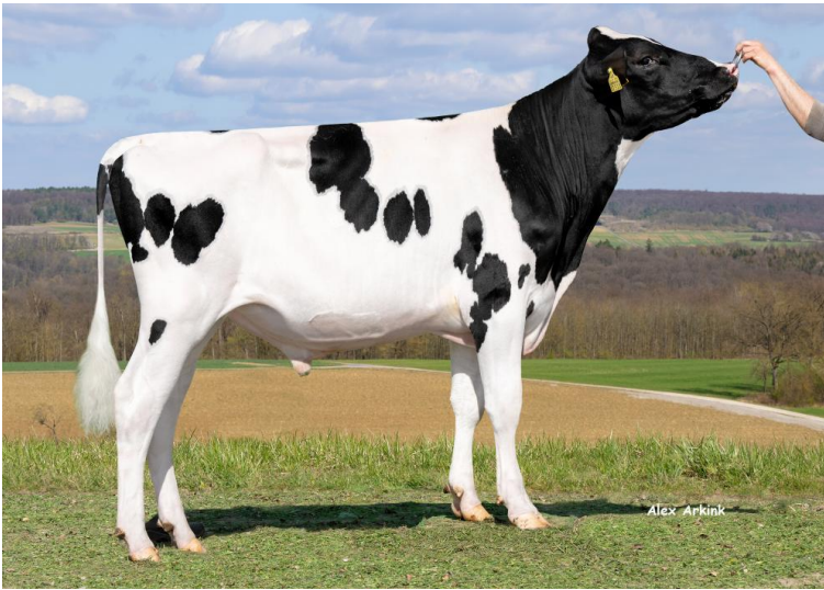
Netfli PP RF

Netfli PP RF ist ein früher Speedy-Sohn (v. AtaZazzle) der über den Outcross-Vererber Kitami auf die sehr einflußreiche Familie von MR Snow Aida VG-86 (Dixie-Lee Aspen EX-92) zurückgeht, aus welcher bereits eine Reihe an Besamungsbullen im In- und Ausland in den Einsatz gegangen sind. Netfli selbst überzeugt durch eine hohe Leistung mit positiven Inhaltsstoffen, eine gute Nutzungsdauer sowie ein attraktives Exterieur mit abfallenden Becken, den zum Ausgleich häufig gesuchten, leicht gewinkelten Hinterbeinen sowie sehr guter Eutervererbung mit längeren Strichen. Durch sehr leichte Geburten kann Netfli gut auf Färsen eingesetzt werden. Da der Rottfaktor über Generationen von sbt. Vorfahren weitergegeben wurde, ist Netfli auch eine interessante Option für die Rbt.-Zucht. Netfli stammt nicht aus ET und testet Kappa-Kasein BB.